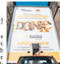
Ein Banner als Dankeschön.

HILDESHEIM. 2011 wurde das Deutschlandstipendien-Programm durch das Bundesministerium für Bildung und Forschung ins Leben gerufen. Seitdem beteiligen sich die HAWK und die Stiftung Universität Hildesheim mit Unterstützung von Bürgerinnen und Bürgern, Unternehmen und Stiftungen an dem Programm. Viele Studierende beider Hochschulen konnten bereits mit einem Stipendium ausgezeichnet und in ihrem Studium unterstützt werden. Insgesamt 979 Stipendien konnten seitdem an Studierende in Hildesheim vergeben werden. Mit dem nun bevor-